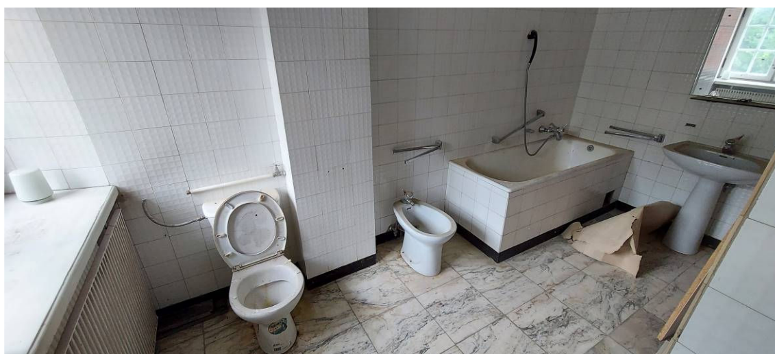
Fot. 8 Łazienka Ł5