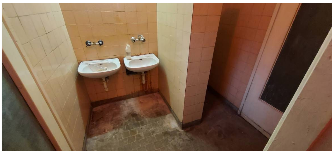
Fot. 17 Łazienka Ł14