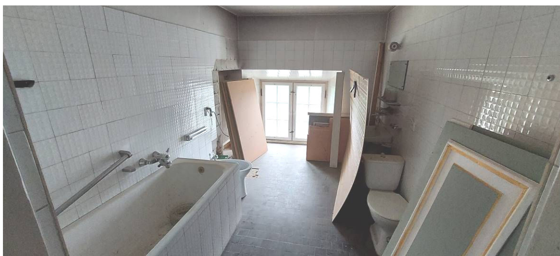
Fot. 10 Łazienka Ł7