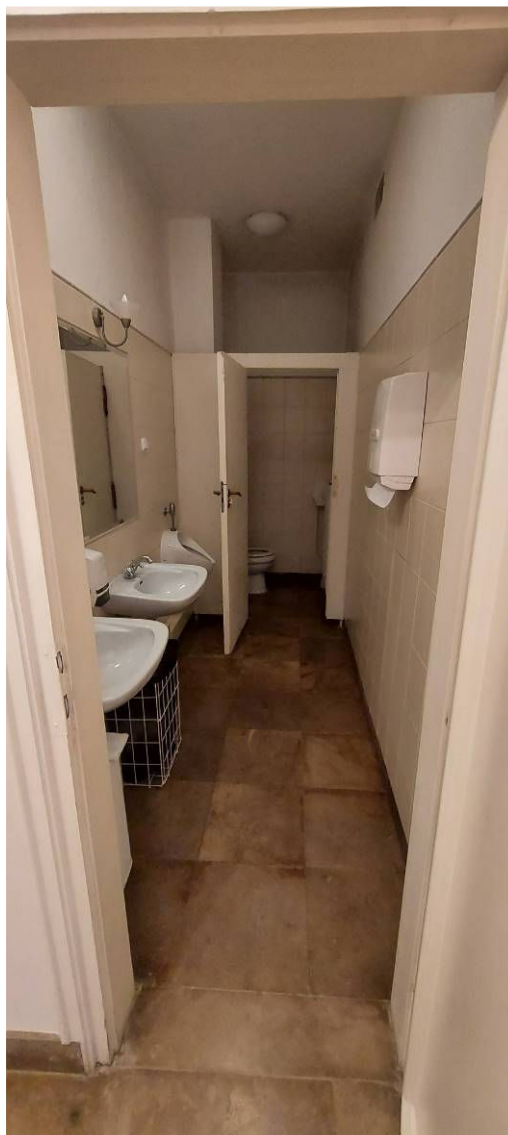
Fot. 3 Łazienka Ł2