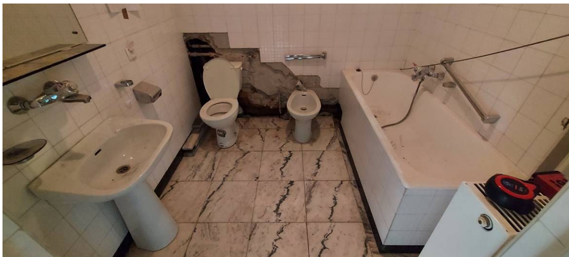
Fot. 11 Łazienka Ł8