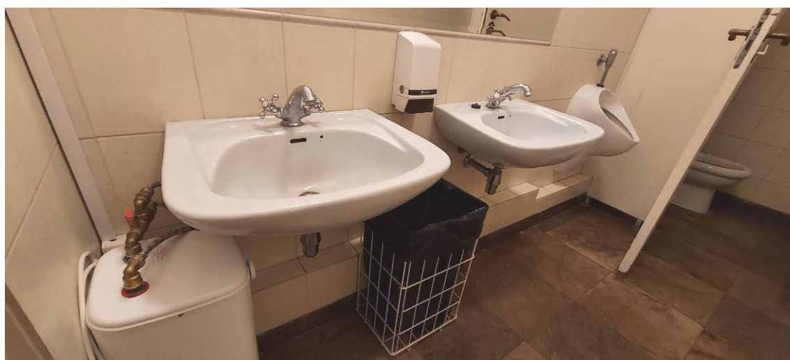
Fot. 4 Łazienka Ł2