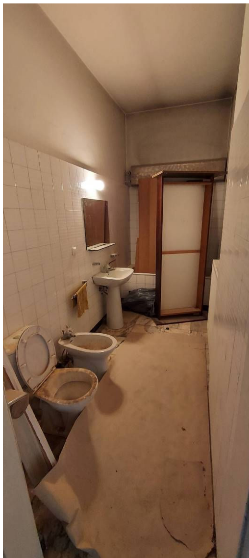
Fot. 9 Łazienka Ł6