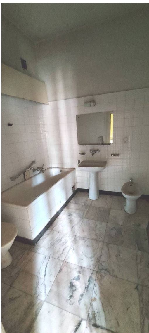
Fot. 12 Łazienka Ł9