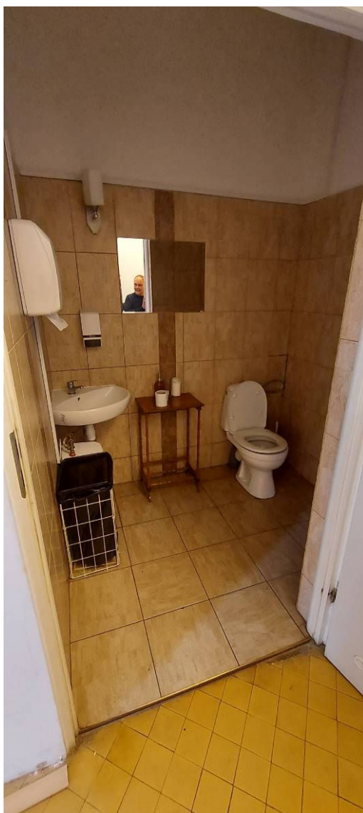
Fot. 14 Łazienka Ł12