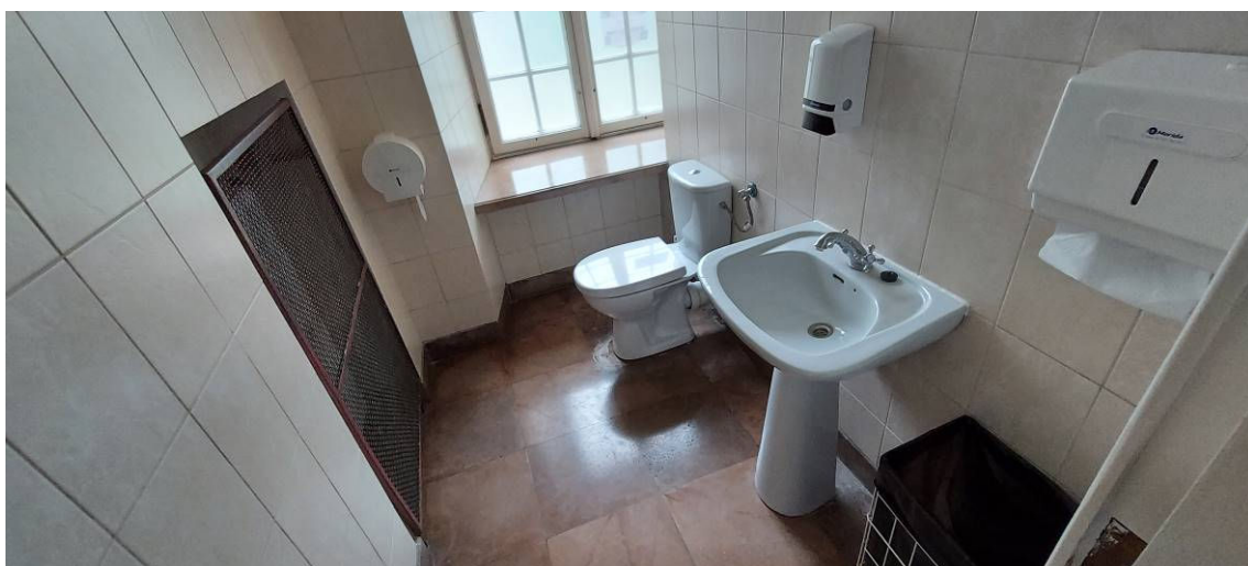
Fot. 2 Łazienka Ł1