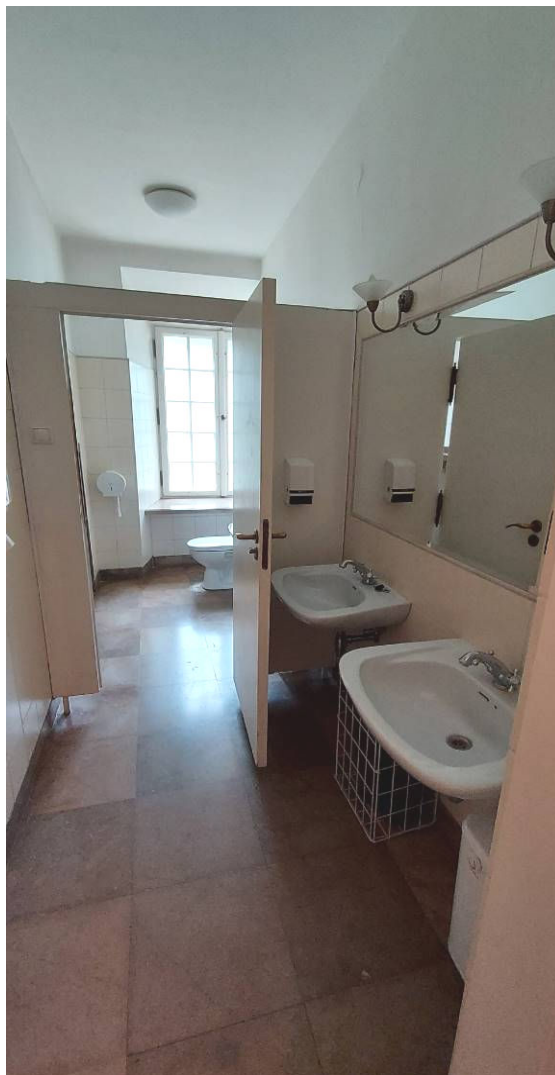
Fot. 1 Łazienka Ł1