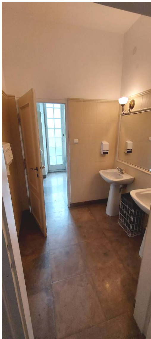
Fot. 5 Łazienka Ł3