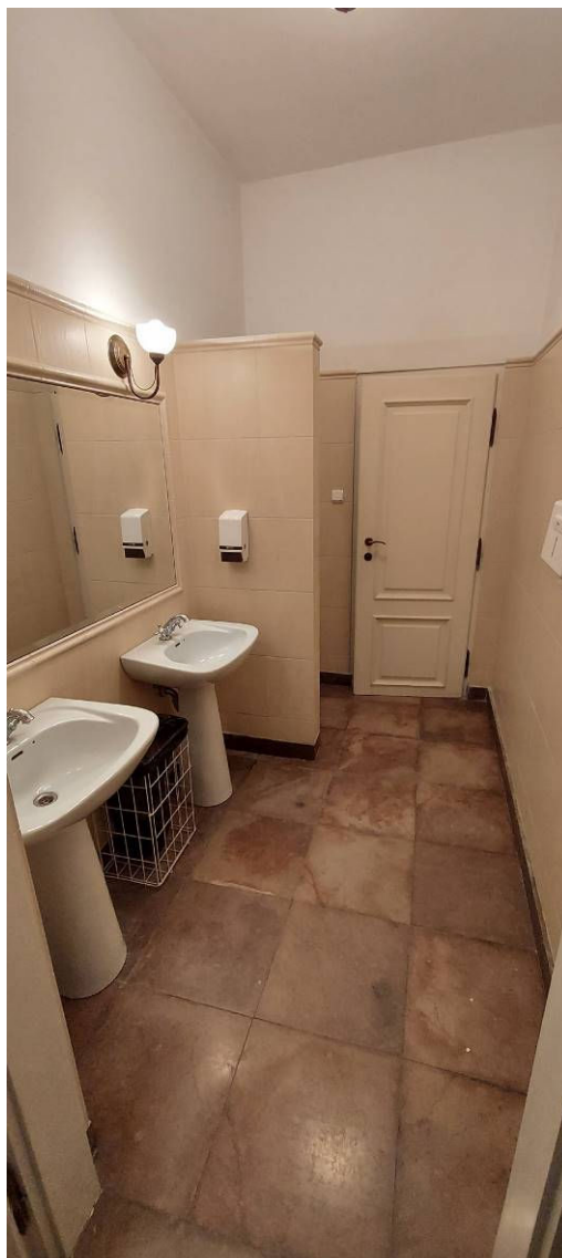
Fot. 7 Łazienka Ł4