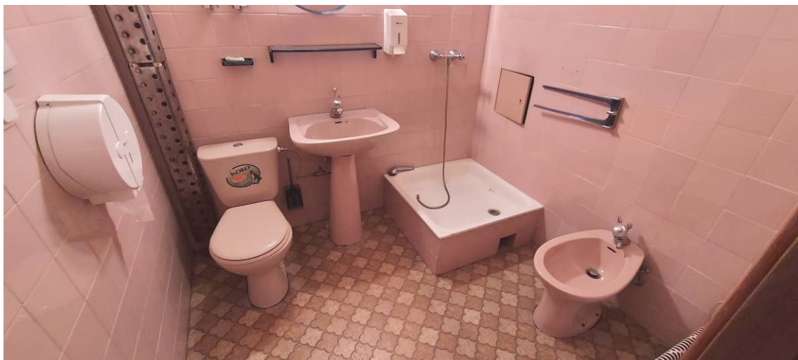
Fot. 13 Łazienka Ł10