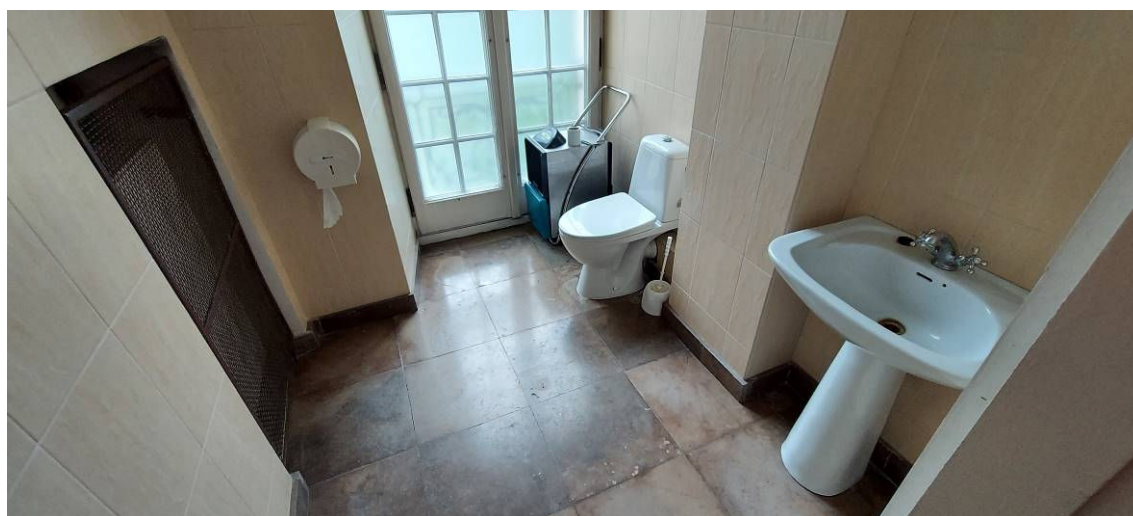
Fot. 6 Łazienka Ł3