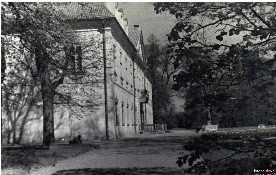
1935r. (zdjęcie z albumu rodziny Brzezińskich), Cyfrowa Biblioteka Narodowa Polona źródło: www.fotopolska.eu