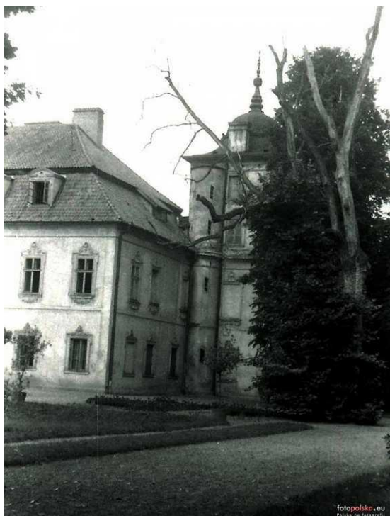
1955r., zdjęcie z archiwum rodzinnego Justyny Wajnikonis-Maciejewskiej, autor: Stanisław Wajnikonis źródło: www.fotopolska.eu