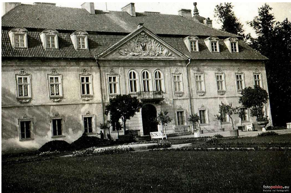
maj 1934r., zdjęcie z archiwum rodzinnego Justyny Wajnikonis-Maciejewskiej, autor: Roman Wajnikonis źródło: www.fotopolska.eu