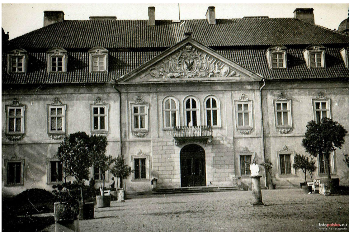
maj 1934r.