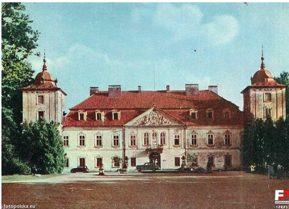
Poczłtówka RUCH, najprawdopodobniej pomiędzy 1958 a 1960r.

Z danych zawartych w inwentaryzacji wykonanej w 1961r. wynika, że w tamtym okresie pałac był tylko częściowo podpiwniczony - posiadał tylko dwa pomieszczenia (kotłownię i skład koksu). W 1968r. nastąpiła przebudowa piwnic polegająca na wykonaniu kanałw instalacyjnych pod całym parterem (z wyłączeniem przestrzeni pod okrągłymi kłatkami schodowymi oraz główną kłatką schodową łączącą parter i piętro) – data ustalona na podstawie informacji otrzymanych od pracowników pałacu. W związku z prowadzonymi pracami najprawdopodobniej wtedy zdecydowano się na wymianę w poziomie parteru oraz niewielację dotychczasowych stopni w rejonie kredensu i kuchni na parterze.