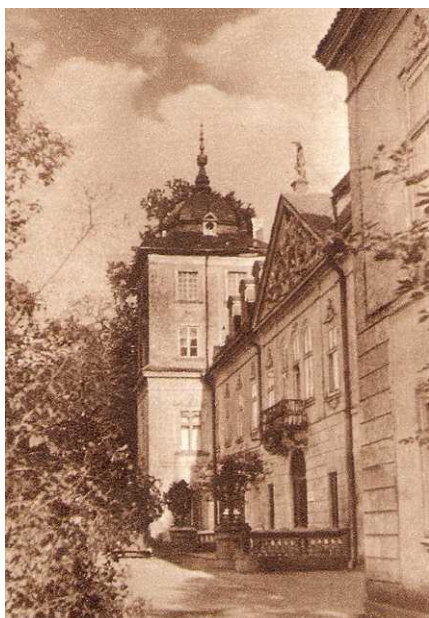
Najprawdopodobniej w latach 1948-1950r.