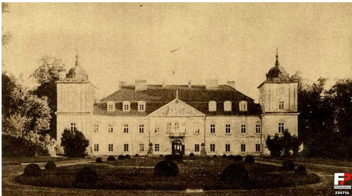
Najprawdopodobniej po 1929r.