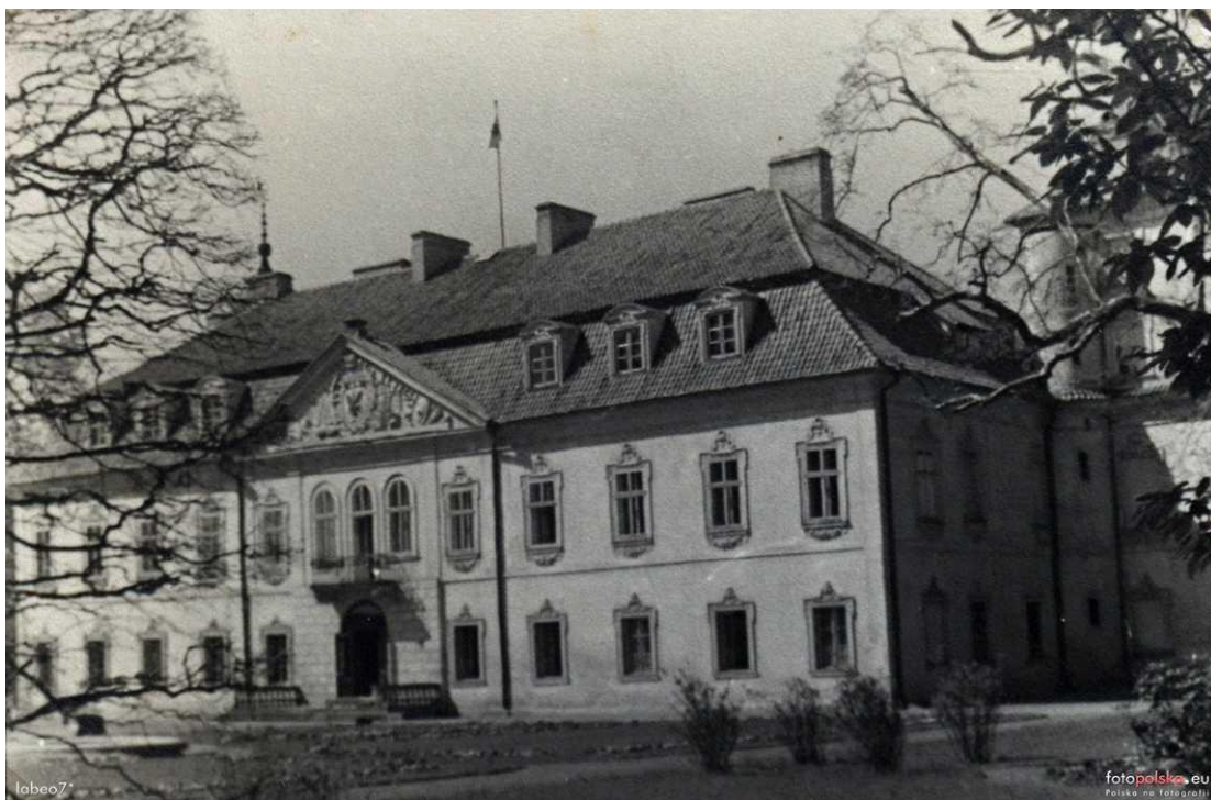
1935r. (zdjęcie z albumu rodziny Brzezińskich), Cyfrowa Biblioteka Narodowa Polona źródło: www.fotopolska.eu