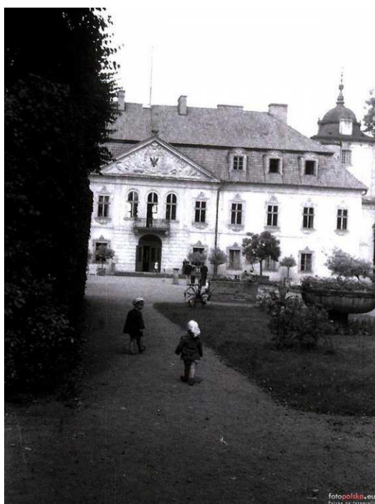
1955r., zdjęcie z archiwum rodzinnego Justyny Wajnikonis-Maciejewskiej, autor: Stanisław Wajnikonis źródło: www.fotopolska.eu