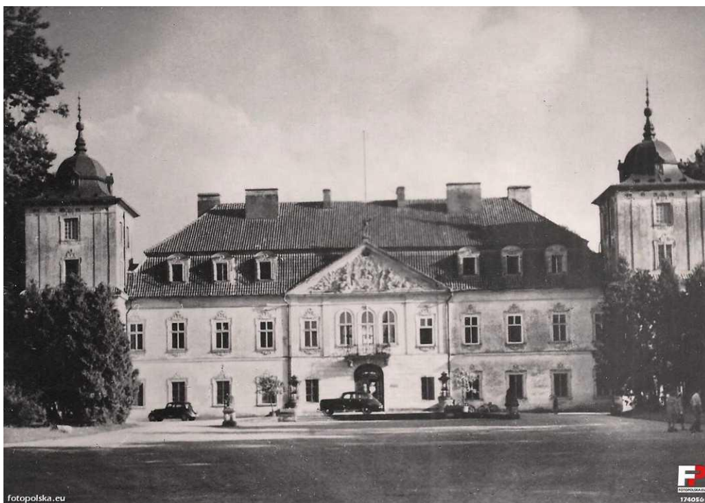
Pomiędzy 1956 a 1962r.