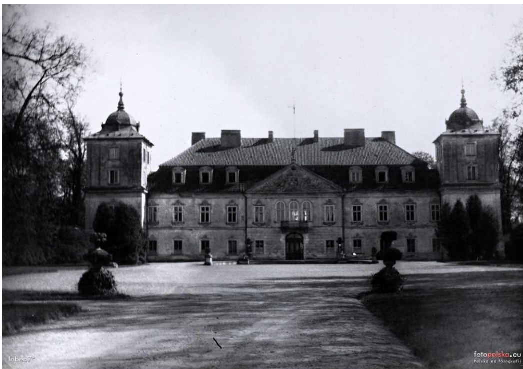
1935r. (zdjęcie z albumu rodziny Brzezińskich), Cyfrowa Biblioteka Narodowa Polona źródło: www.fotopolska.eu